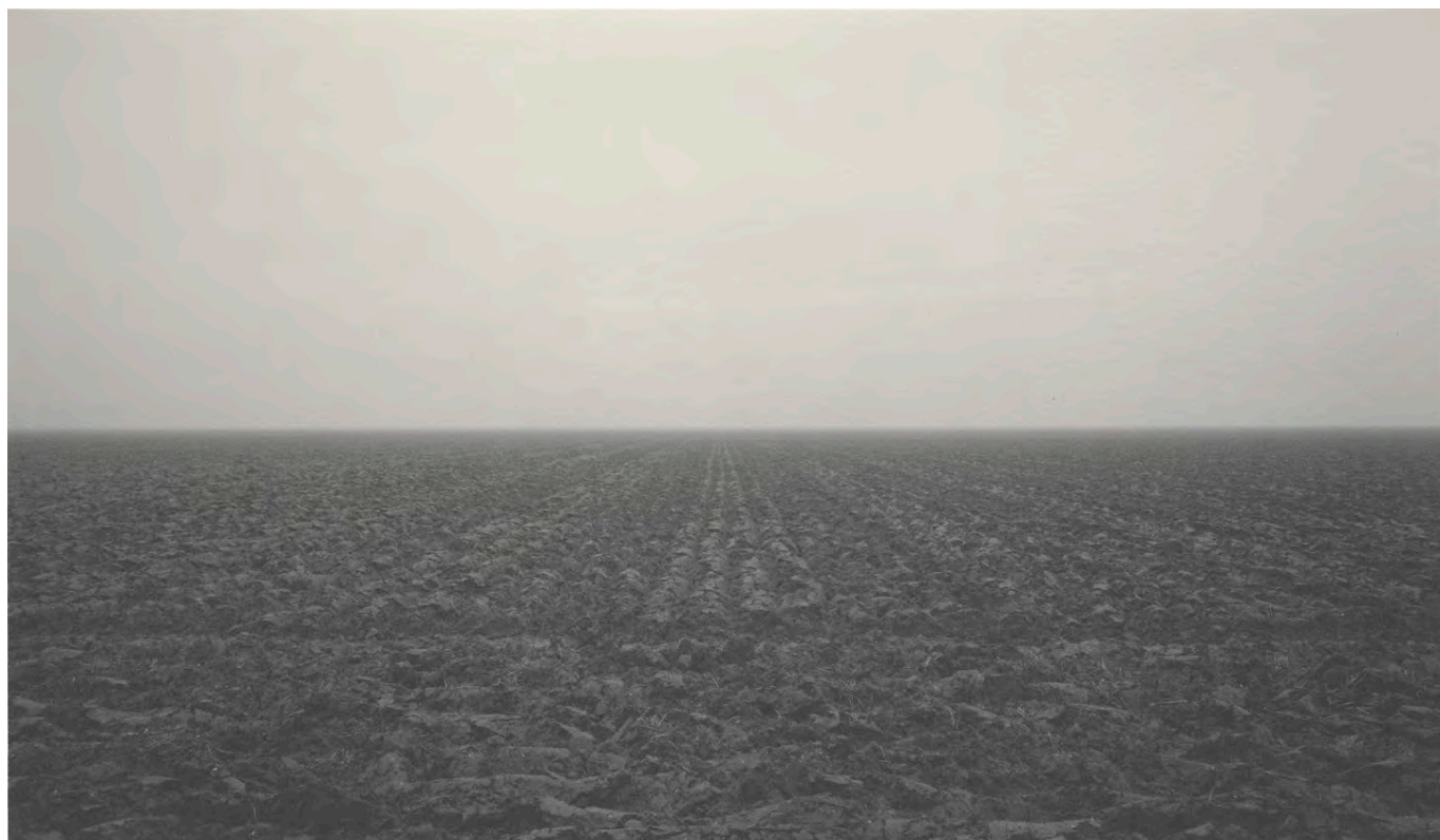
96.020. Witho Worms. Polderland 10 , 2005, uit de serie polderlandschappen van de Flevo- en Noordoostpolder

de Langevelderslag, de Waterleiding- en de Kennemerduinen. Het zijn openbare stranden en duingebieden, die populair zijn voor zwemrecreatie of een wandeling door de frisse zeewind. Het duinlandschap is op natuurlijke wijze ontstaan door sedimentatie van zand uit zee. Door afkalving van de kust wordt deze tegenwoordig echter weer in hoge