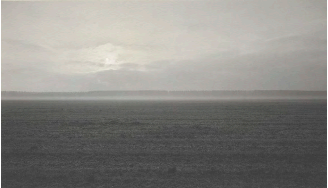
96.019. Witho Worms. Polderland 4 , 2005, uit de serie polderlandschappen van de Flevo- en Noordoostpolder

Universiteit Leiden heeft de afgelopen periode meerdere projecten met het thema landschapsfotografie verworven. Dit stuk bespreekt twee voorbeelden: een serie polderlandschappen gefotografeerd door Witho Worms (1959) en een serie kustlandschappen van fotograaf Harm Botman (1952 – 2012). Ali Shobeiri, de nieuwe universitair docent bij de masteropleiding Film and Photographic Studies, benoemt in dit artikel de twee heel verschillende zienswijzen van deze fotografen. De series creëren ieder op hun eigen manier een 'plaatsgevoel', ofwel 'sense of place'.